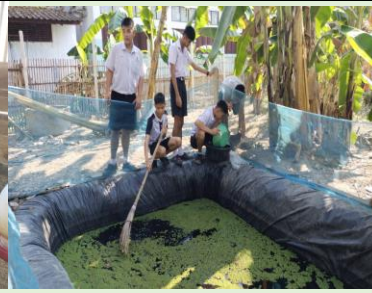
การทำอาหารหมักไก่