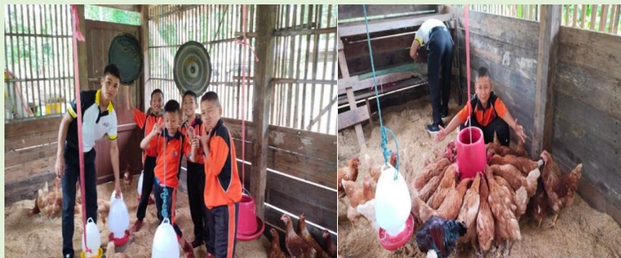
การให้น้ำและอาหารไก่