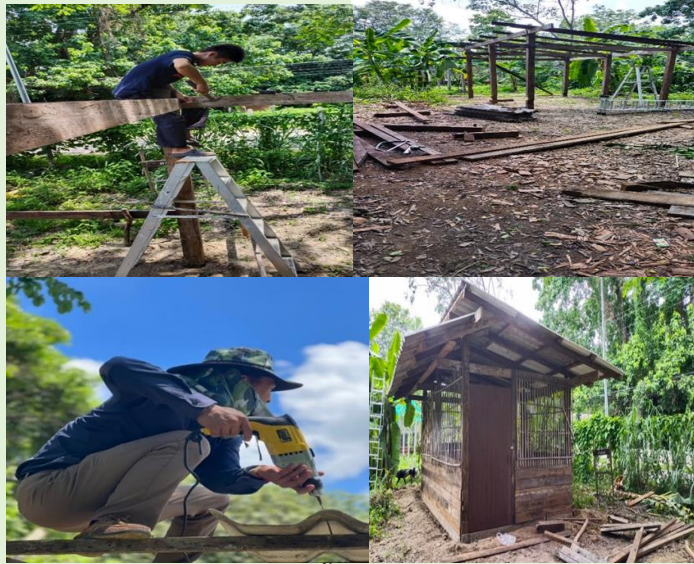
การเตรียมสถานที่ภายในโรงเลี้ยงไก่